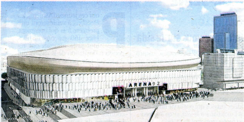
Hier à Neuilly, sous la houlette d'Environnement 92, plusieurs associations de Courbevoie, Puteaux, Nanterre et Neuilly ont manifesté leur hostilité aux projets des tours Phare et Hermitage et du complexe Arena (de gauche à droite).